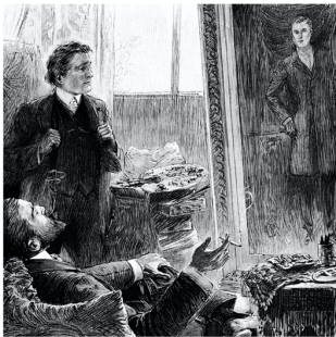
illustration Paul Thiriat

précédé et suivi d'un propos d'Octave Mirbeau illustré par sept dessins de Paul Thiriat